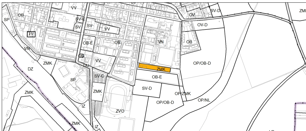
Záakes návrhu na pořizení změny schválený usnesením ZHMP č. 10/17 ze dne 17. 10. 2019