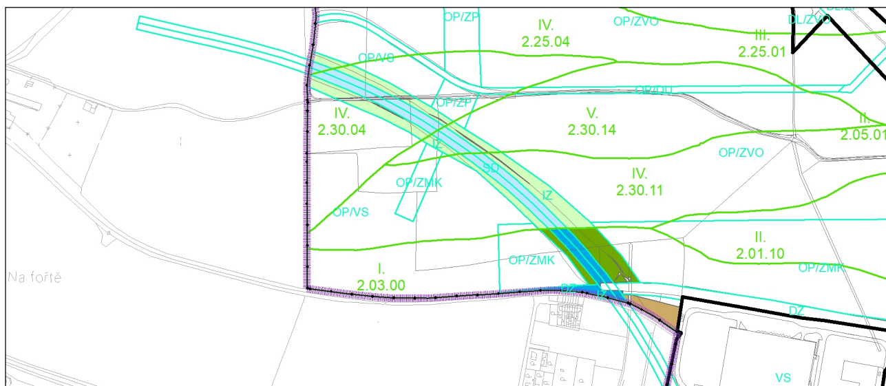
Výkres č. 20 – Vyhodnocení záborů ZPF a PUPFL, platný stav k 1. 1. 2019