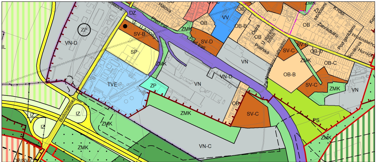
Výkres č. 4 – Plán využití ploch, platný stav k 17. 6. 2021