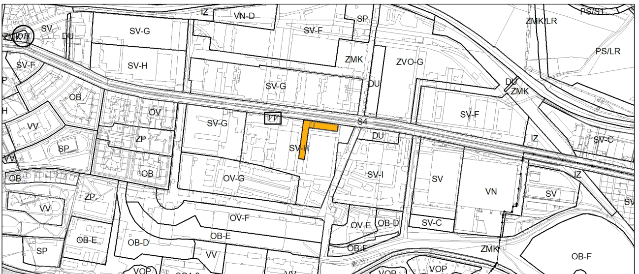
Zákres návrhu na pořízení změny schválený usnesením ZHMP č. 22/12 ze dne 17. 12. 2020