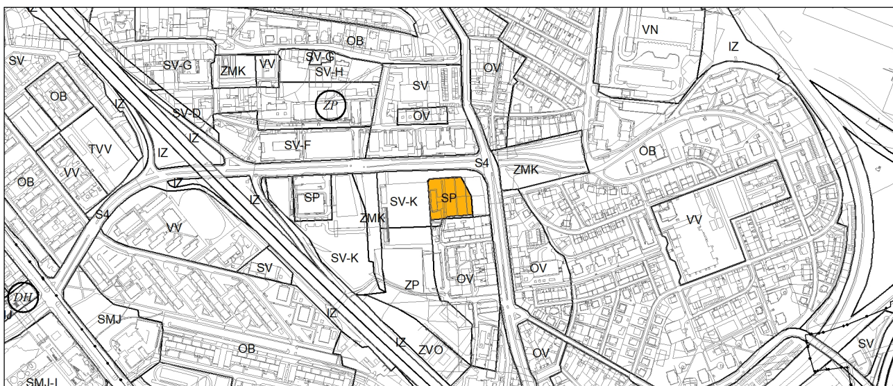
Zákras zadání změny schválený usnesením ZHMP č. 12/16 ze dne 12. 12. 2019