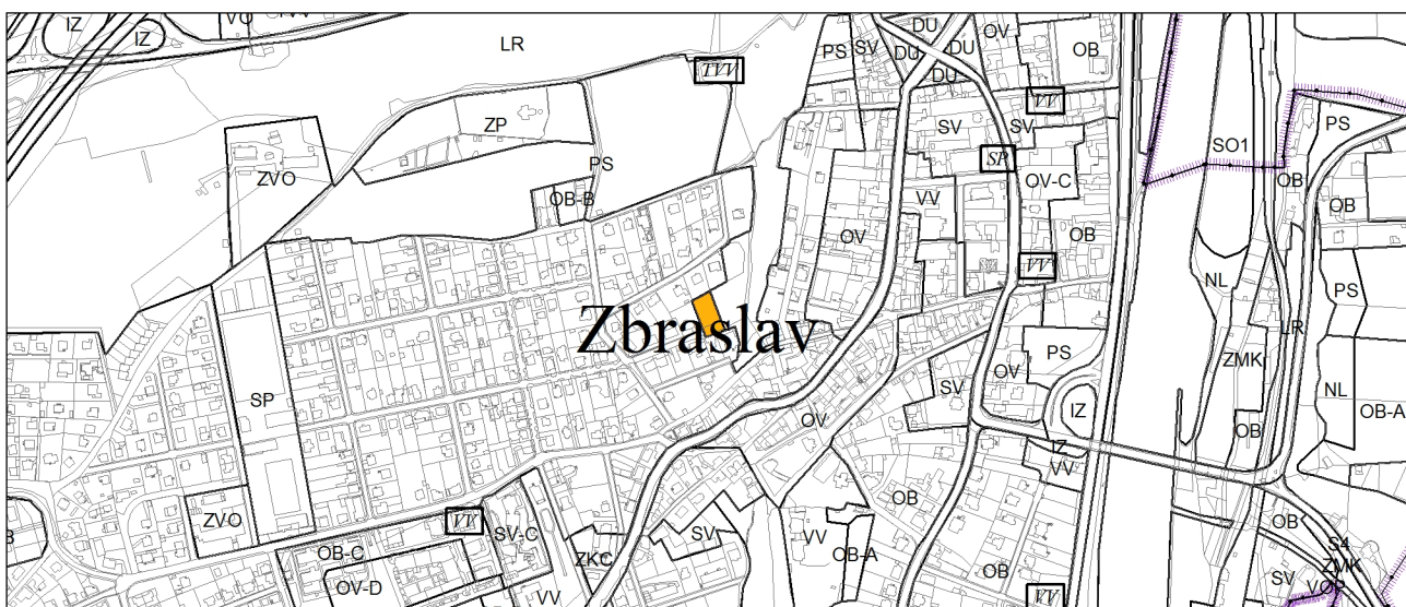
Zákes zadání změny schválený usnesením ZHMP č. 38/74 ze dne 14. 6. 2018