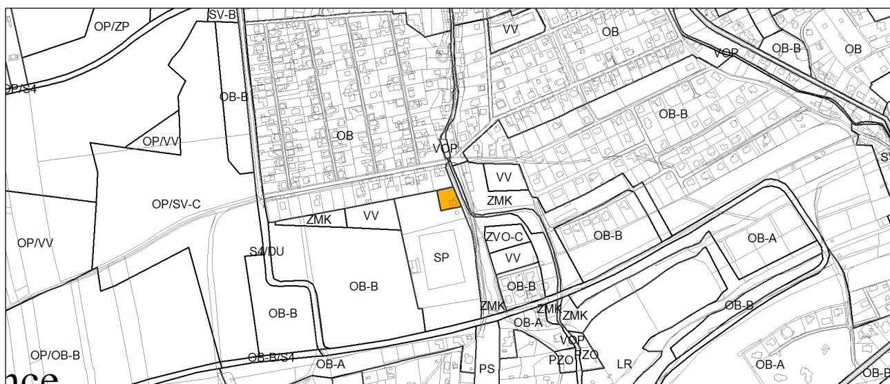
Zářes zadání změny schválený usnesením ZHMP č. 38/74 ze dne 14. 6. 2018