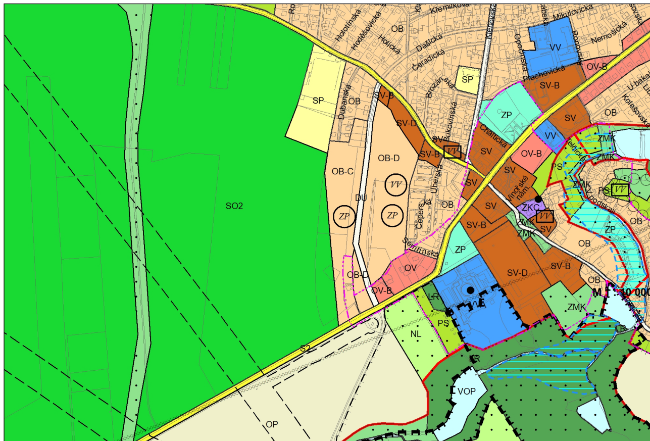
Výkres č. 4 – Plán využití ploch, platný stav k 1. 1. 2019