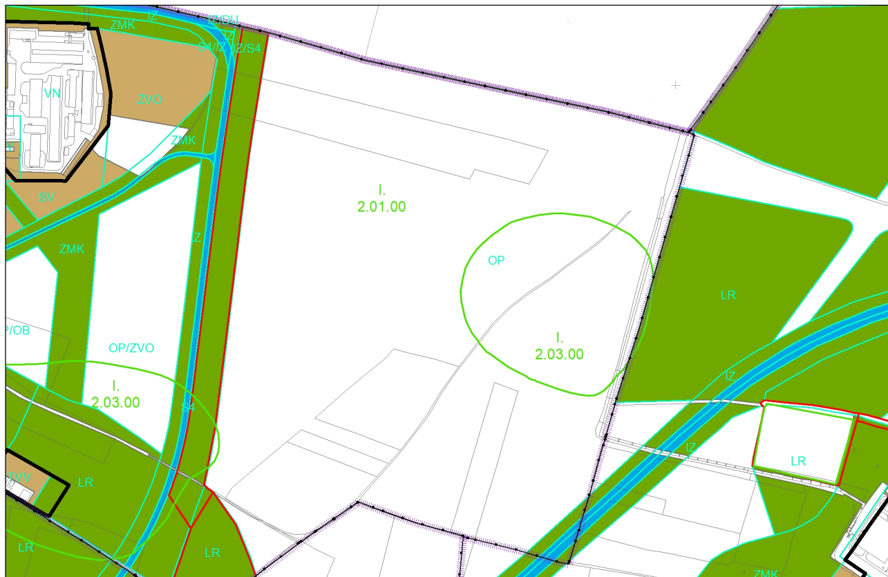
Výkres č. 20 – Vyhodnocení záborů ZPF a PUPFL, platný stav k 1. 1. 2019