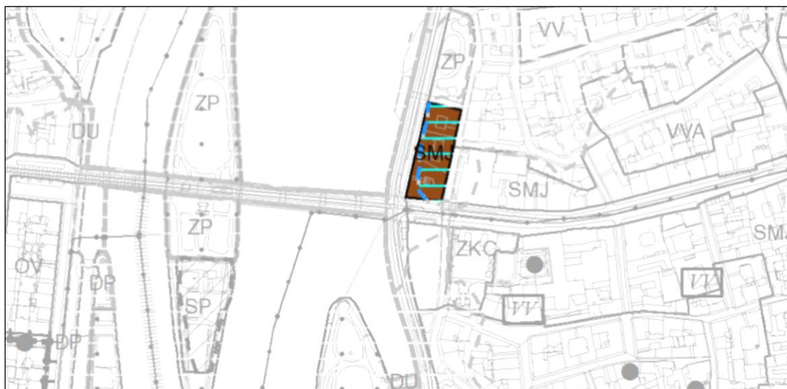
Ilustrační výřez výkresu č. 04 Plán využití ploch návrhu pro veřejné projednání

Na základě pokynů ZHMP k úpravě návrhu změny bylo řešené území změny redukováno o navrhovanou stabilizovanou plochu smíšené městského jádra /SMJ/ v rozsahu 3 206 m 2 ve prospěch stávající plochy zvláštní komplexy občanského vybavení – vysokoškolské /ZVS/. Upravená plocha /SMJ/ bude nově navazovat na stávající plochu /SMJ/, návrhem změny nevznikají podměrečné plochy nezobrazitelné v územním plánu.