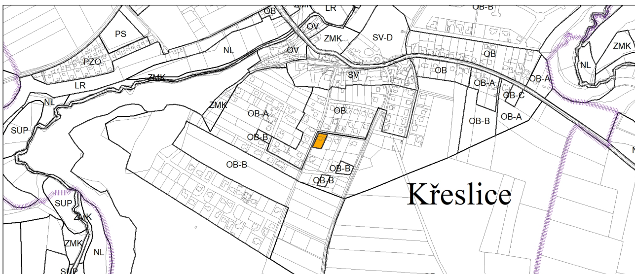
Zákes zadání změny/úpravy schválený usnesením ZHMP č.12/10 ze dne 12.12. 2019