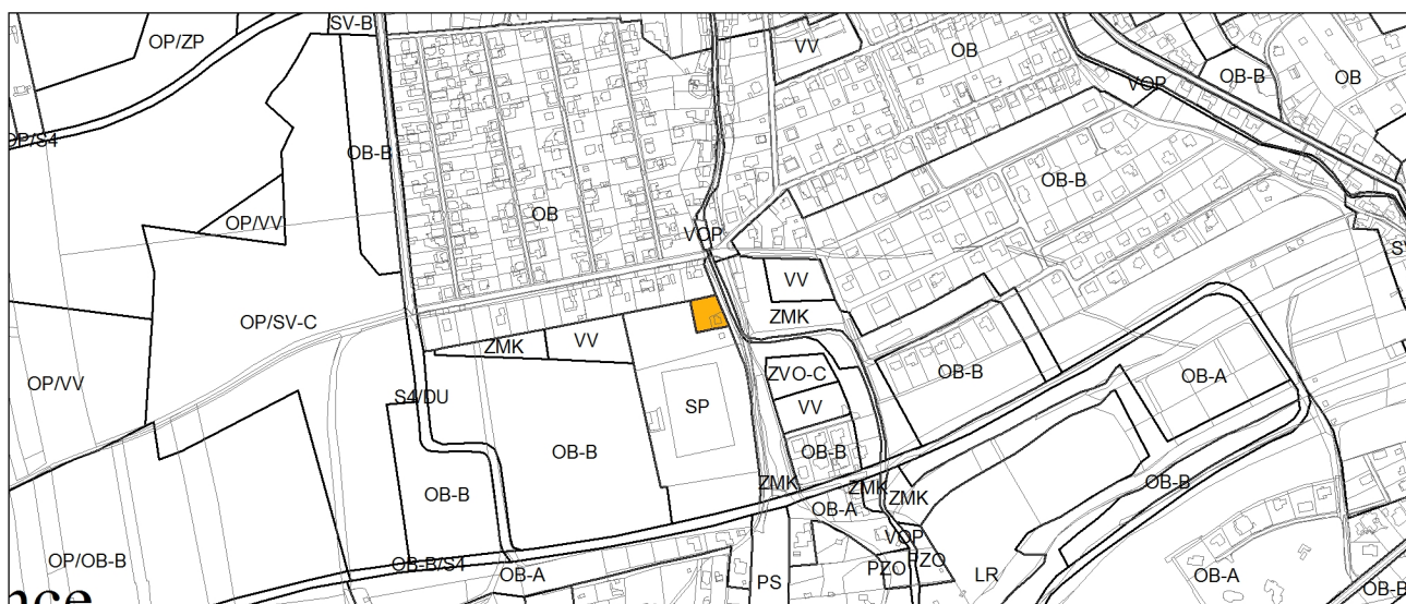
Zářes zadání změny schválený usnesením ZHMP č. 38/74 ze dne 14. 6. 2018