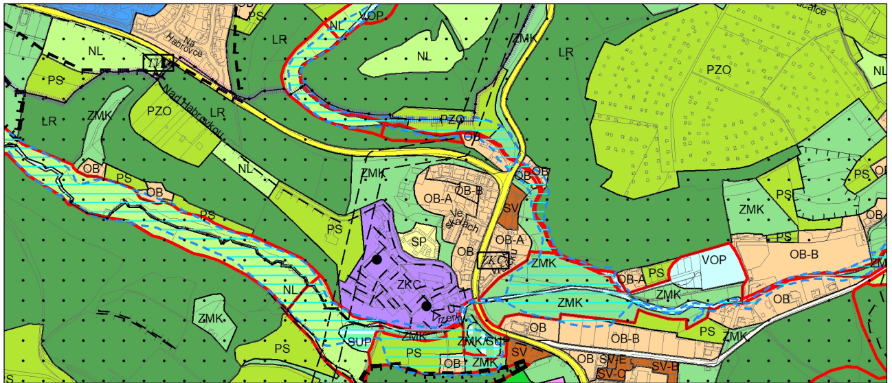
Výkres č. 4 – Plán využití ploch, platný stav k 1. 1. 2020